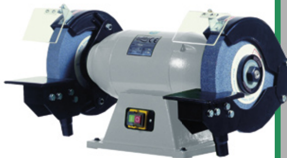
■ HU 300 BG