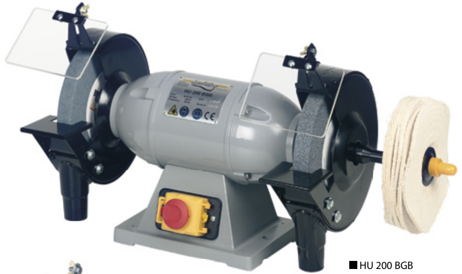
■ HU 200 BGB