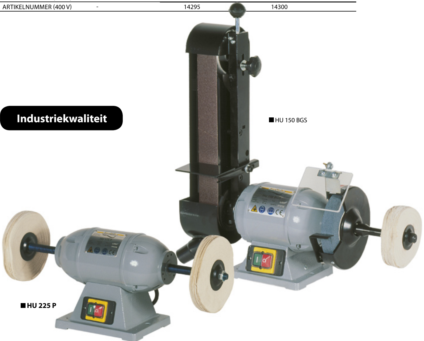
■ HU 225 P