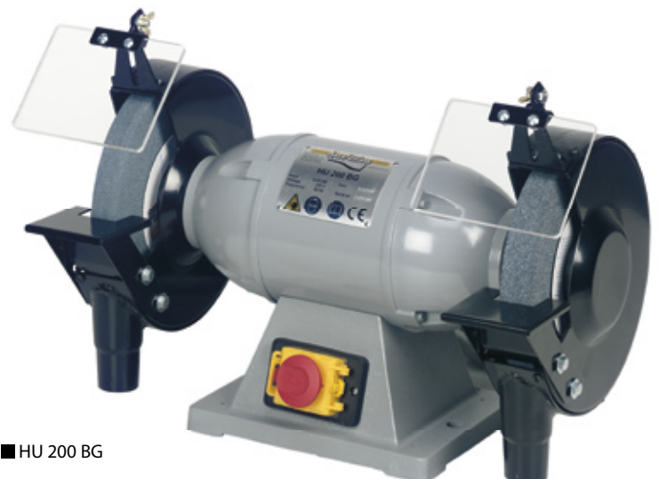
■ HU 200 BG