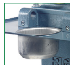
werkblad met koelvloeistofbakje