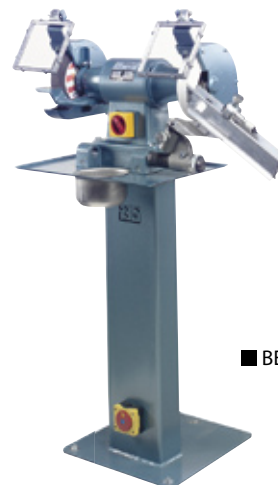
■ BEP 308 AB