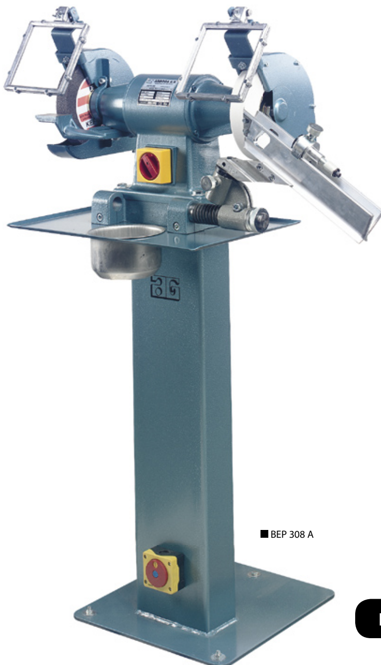
■ BEP 308 A