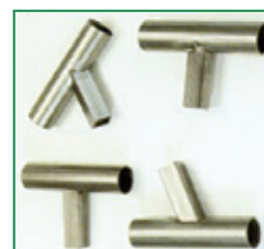
pijpen met een diameter van 21 - 70 mm kunnen onder een hoek van 45 - 90° worden geslepen