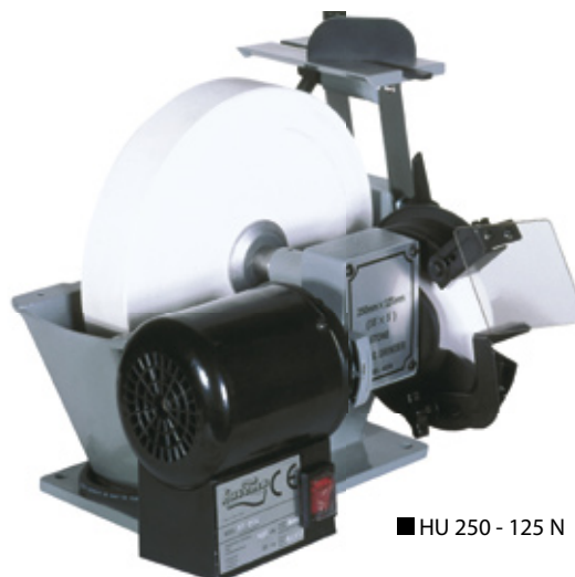
■ HU 250 - 125 N