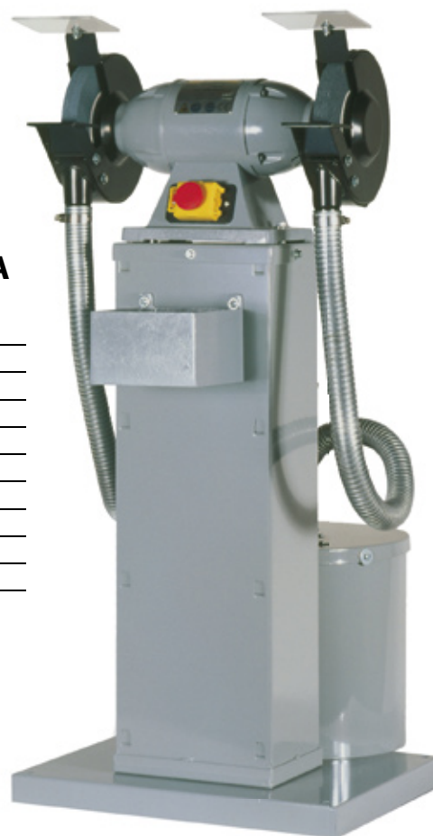
■ HU 200 BGA