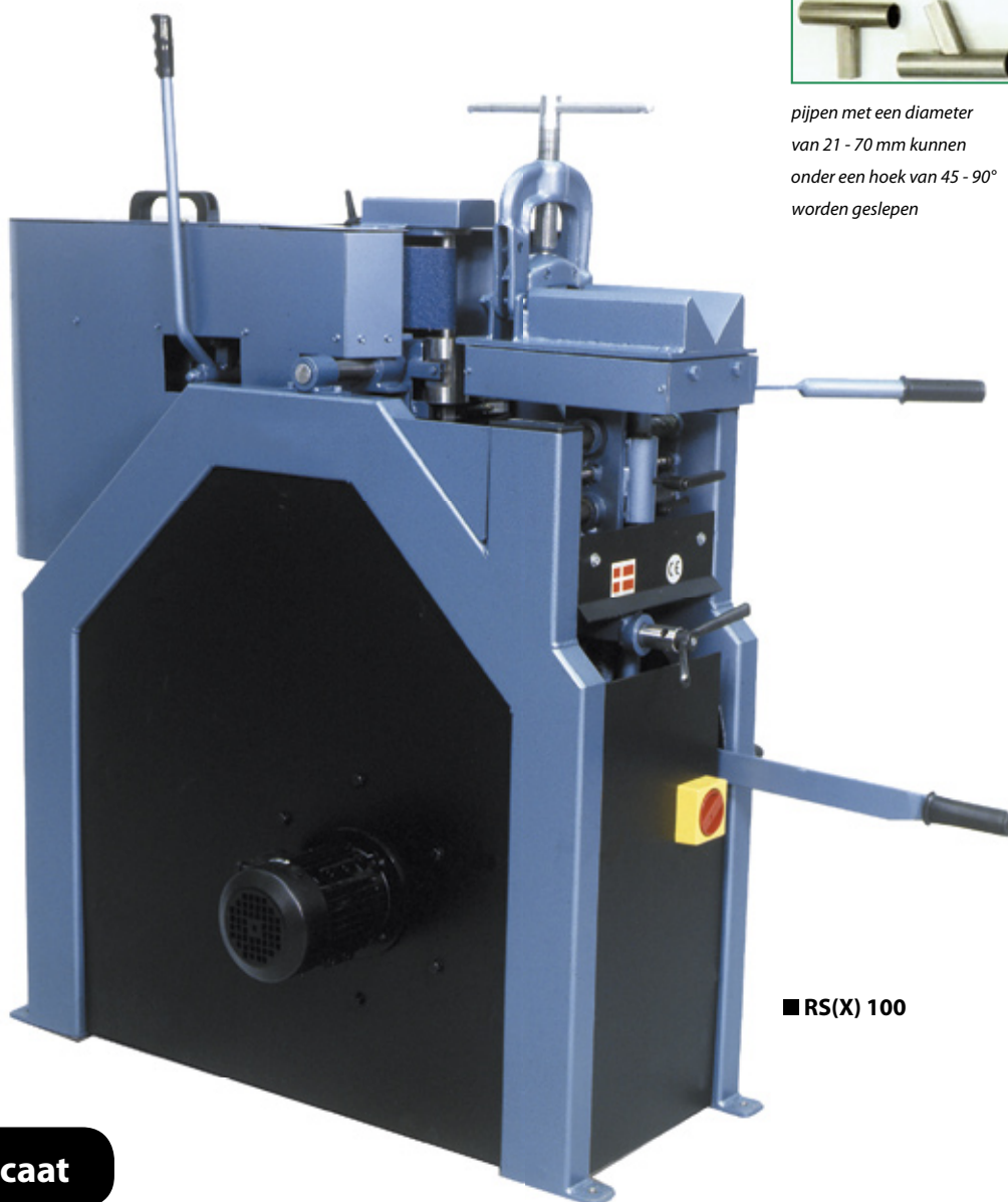
■ RS(X) 100