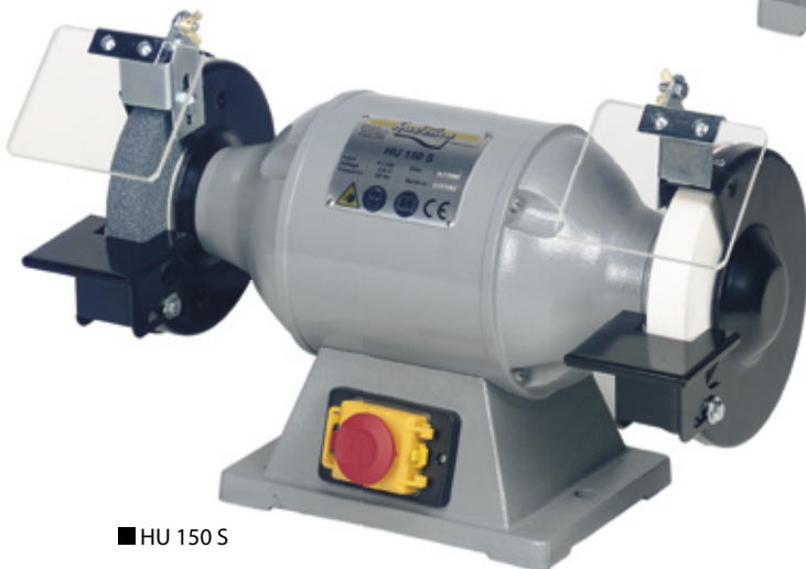
■ HU 150 S